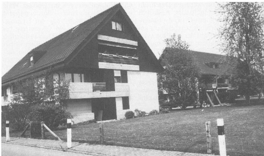
Am 4. August 1969 beschliesst die Holzkorporation-Generalversammlung aus dem Erlös der (in der «Au» und im «Rohr» getätigten und für Nationalstrassenbau und Flughafen-ausbau benötigten) verkauften grossen Landstücke einen beträchtlichen Geldbetrag für den Häuserbau sicherzustellen. Am 23. Januar 1973 sind die Bauten beendet. Im Laufe von 1973 werden in beiden Mehrfamilienhäusern an der oberen Wallisellerstrasse alle Wohnungen von den Mietern bezogen.

Nun haben aber gerade unsere Bauern in Opfikon eh und je das Fundament der Holzkorporation gebildet. Es waren stets nur wenige Anteilhaber, welche nicht zugleich auch Landwirte waren. Zum Bauerngut gehört Wald. Was wird nun aber mit dem Waldbesitz der Korporation geschehen, wenn der Landwirte immer weniger werden, wenn einer nach dem anderen den Kampf mit den «steinernen Fingern», die seinen Grund und Boden weggraben wollen, als aussichtslos aufgeben müsste? Eines ist gewiss: Die Körperschaft könnte mindestens nicht mehr in der heutigen Form weiterbestehen. Sie müsste zweifellos auf eine ganz neue Basis gestellt werden. Oder würde sie am Ende gar von der Bildfläche verschwinden, nachdem die Gemeinde oder der Staat die Aufgabe über-