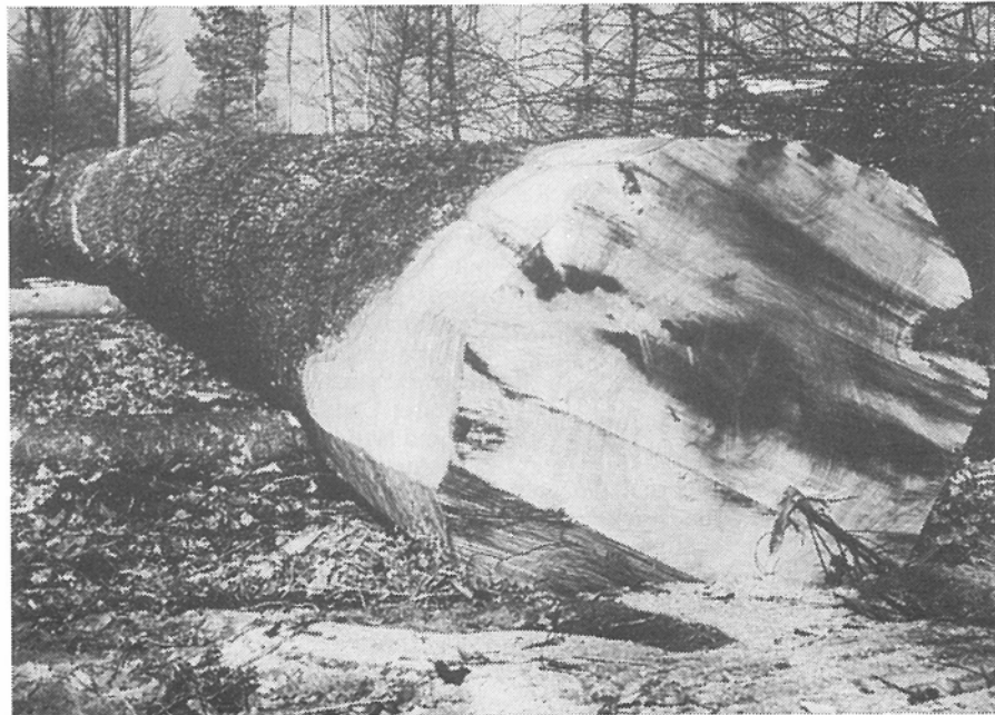
Der Riese ist gefallen; da liegt sie nun, die mindestens 150jährige, mächtige Qualitätseiche von etwa fünf Kubikmeter Holzmass (die dunklen Partien sind nicht etwa faules, sondern wertvolles Kernholz)

Damit aber nicht genug. Zwei Jahre später widerfuhr den Opfiker Waldungen grosses Unheil, der Eisregen vom Februar 1978 vernichtete viel Wald, so dass gebrochene Stämme und zusammengedrücktes Holz in kolossalen Mengen anfiel, nämlich um einige hundert Kubikmeter. Total mussten über 700 m 3 gebrochenes Holz aufgerüstet werden. Davon nicht weniger als 350 m 3 Nutzholz, 370 m 3 Papier- und Industrieholz sowie 40 m 3 (oder Ster) Brennholz. Logisch, zufolge Überangebot