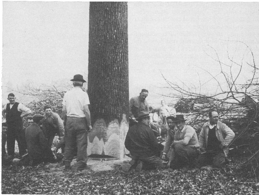
Kurze Säge-Pause; auf jeder Seite des Eichstammes sägen je vier Männer mit der grossen Waldsäge, bis dann — mit Hilfe von Holzkeilen «gesteuert» — die Eiche in die gewünschte Richtung fällt

Als ein Vorhaben, das für eine breite Öffentlichkeit (und zur Freude aller Naturfreunde) verwirklicht wurde, entstand im Jahre 1973 ein sogenannter Nassstandort. In einvernehmlicher Zusammenarbeit zwischen der Holzkorporation und den Gemeinden Kloten und Opfikon, wurde durch Ausbaggern der sumpfigen Waldwiese «im Moos» ein grosser Waldweiher geschaffen. Er ist seither ein vielbesuchter Nassstandort, ein grosses «Biotop» für gefährdete Pflanzen und Tiere, mit Seerosen, Sumpfgäsern, Kröten, Fröschen und manch' anderen Lebewesen mehr.