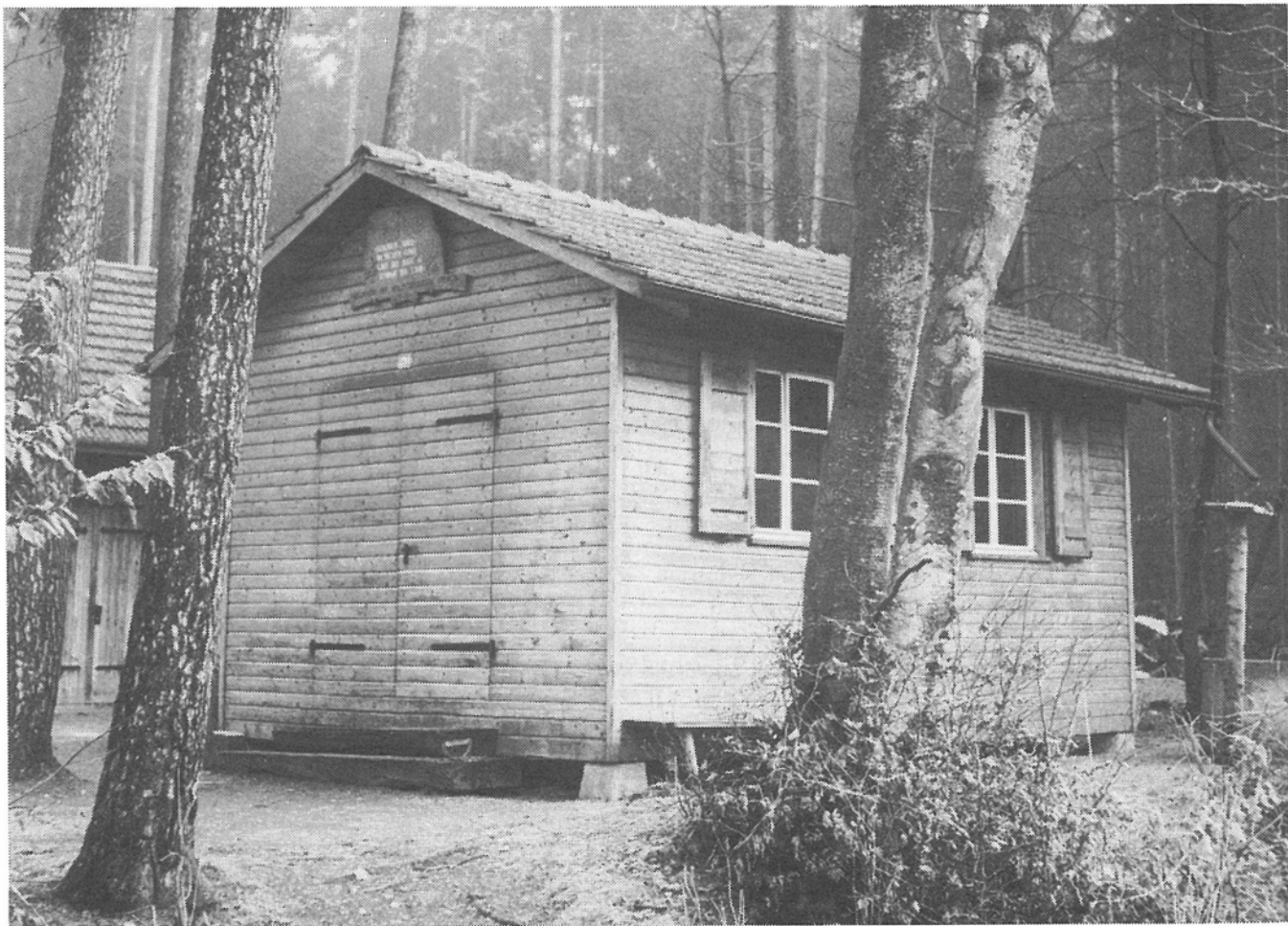
Waldhütte «Häuligrueb» Opfikon: Ausgangspunkt für alle Aktivitäten der Holzcorporation Opfikon.

Fast zwei Jahre später einigen sich die Anteilhaber anlässlich der Generalver-