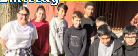
Einmal pro Monat zusammen Zmittag-Essen in der 2. Oberstufe