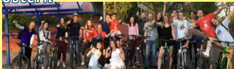
Ostertreffen im April 2019