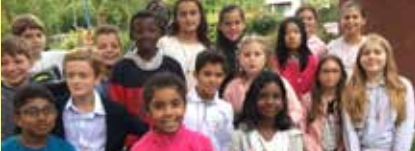
Einige der St. Anna-Ministran- tinnen und -Ministranten!