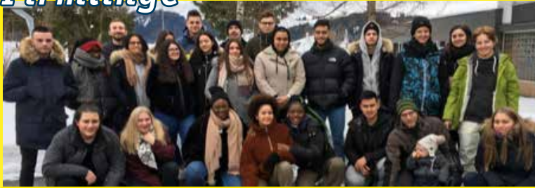
Besinnungsweekend in Einsiedeln mit den Firmlingen