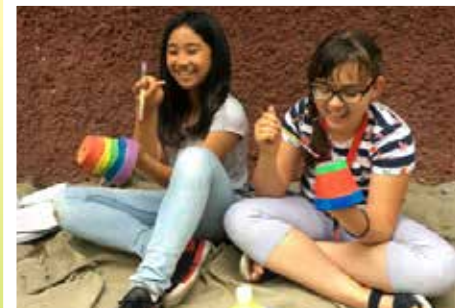
Impressionen aus dem Religionsunterricht