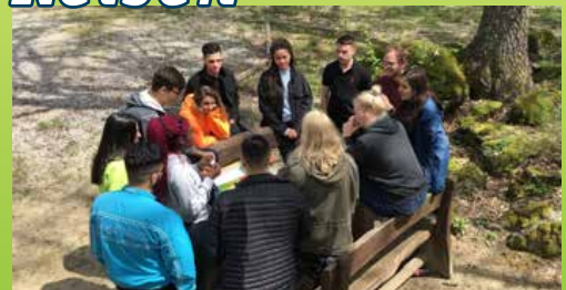
Firm-Reise über Auffahrt nach Florenz und La Verna.