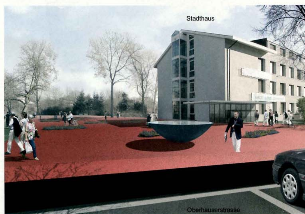
Stadtplatz ohne Parkgarage aus Sicht der Oberhauserstrasse

Für die Kundschaft der Stadtverwaltung werden Parkplätze an der Oberhauserstrasse erstellt. Mit den Alleebäumen zwischen den senkrecht zur Strasse angeordneten Parkplätzen wird eine ansprechende innerstädtische Parksituation entstehen.