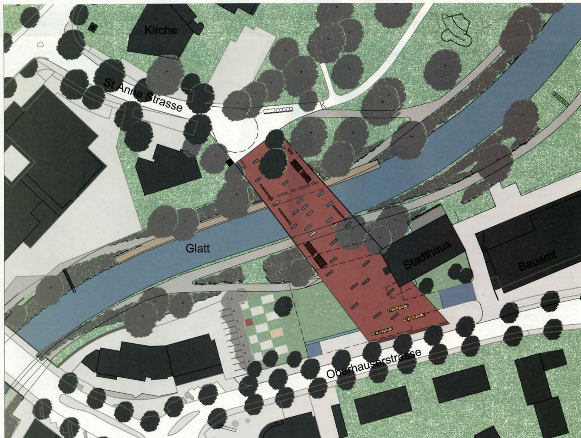
Der Stadtplatz; Erholungs-, Begegnungs- und Repräsentationsraum