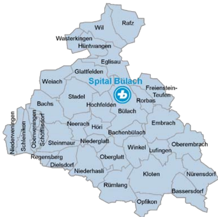
Abbildung 8: Die 35 Gemeinden des Spitalverbands Bülach.