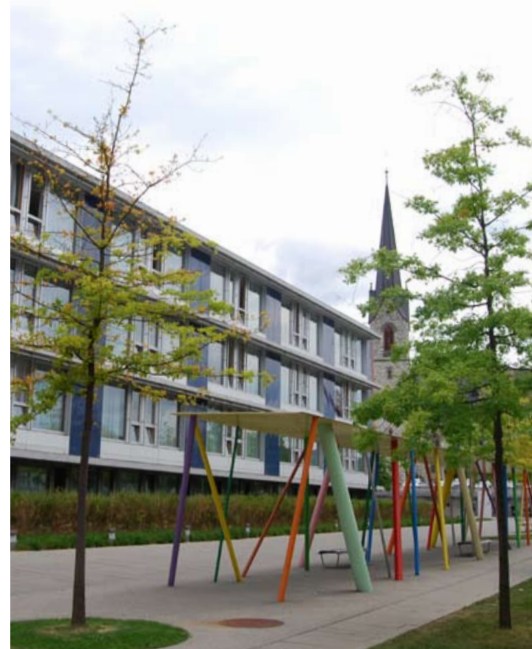
Abbildung 5: Der heutige Bettentrakt E mit den Akutpflegeabteilungen E1 – E3.

Mit der Erweiterung durch diese zusätzliche Akutpflegeabteilung können jährlich rund 1'500 zusätzliche stationäre Patienten behandelt werden.