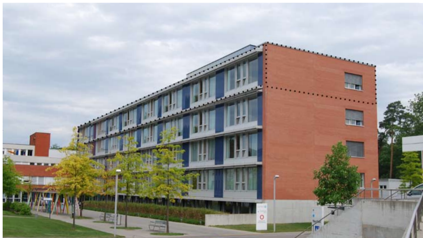
Abbildung 6: Visualisierung der neuen Akutpflegeabteilung E4 auf dem heutigen Bettentrakt E.