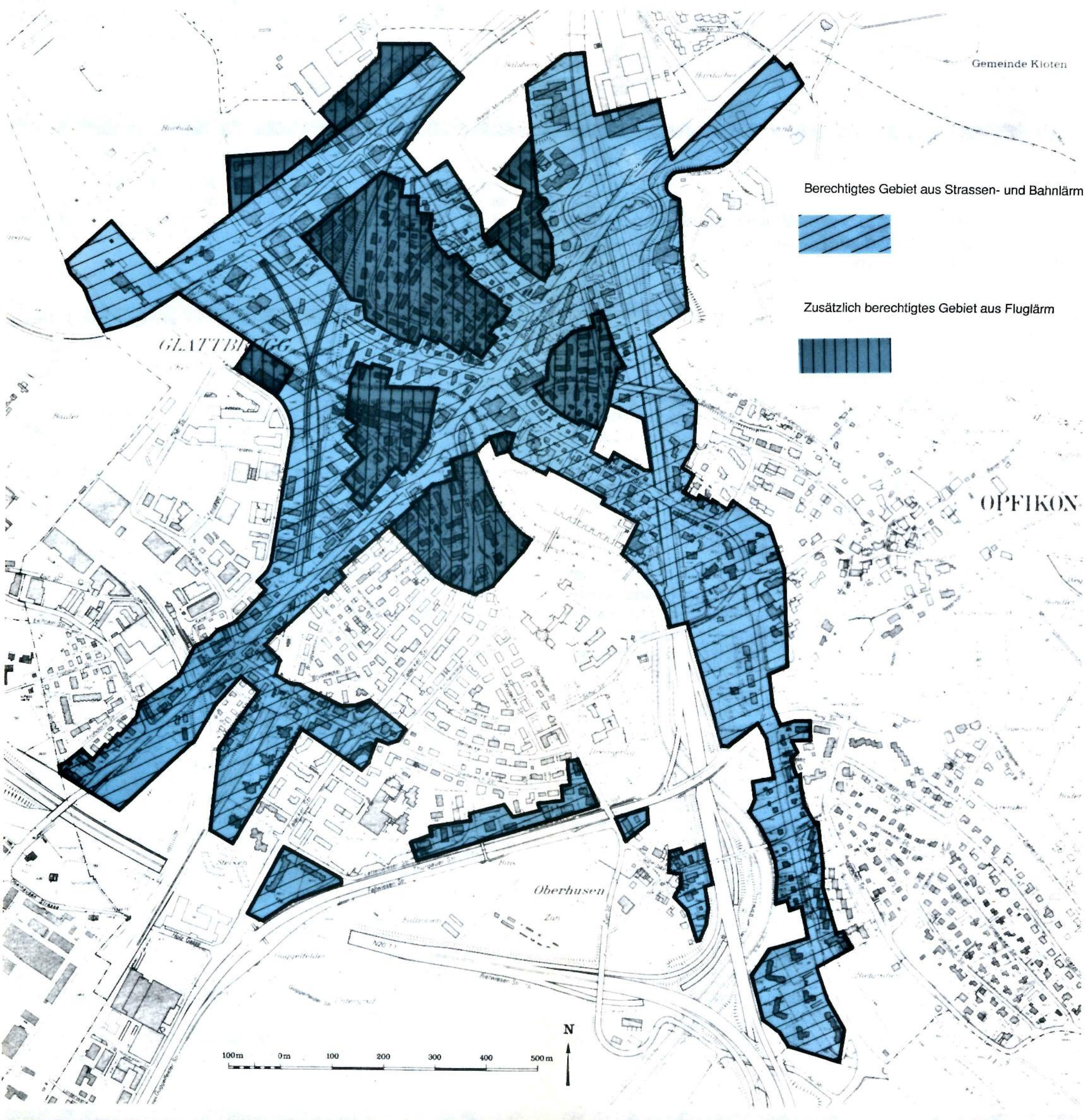
Plan der beitragsberechtigten Gebiete

Dabei erfolgte die lokale Abgrenzung der Gebiete im vom Stadtrat festgelegten Plan grosszügig. Angeschchnittene Liegenschaften werden normalerweise einbezogen, auch wird z.B. auf eine Unterteilung hoher Gebäude in vertikaler Richtung verzichtet. Als Gegenstück, und um unnötige Diskussionen möglichst zu vermeiden, wird die Anspruchsberechtigung ausserhalb dieses Gebietes mit einem um 2 db(A) höheren Grenzwert von L_{eq} 67 db(A) festgelegt.