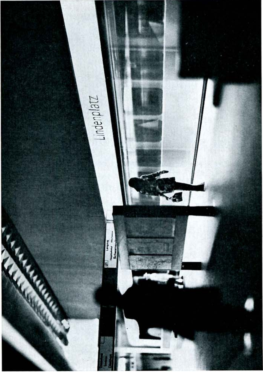
Modellaufnahme einer U-Bahn-Station