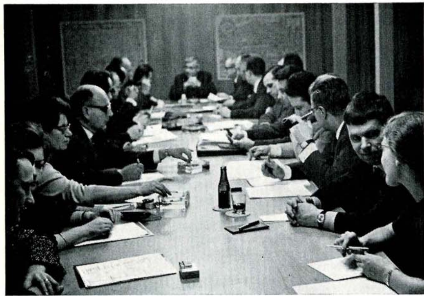
Der Gemeinderat und die Schulpflege empfehlen Annahme der Vorlage!

Der Entscheid über die politische Gleichstellung von Frauen und Männern ist indessen durch die Gemeinde noch besonders zu treffen, d. h. die Politische Gemeinde und die Schulgemeinde haben durch Gemeindebeschluss oder durch eine Änderung der Gemeindeordnung den Schweizerbürgerinnen das Stimmrecht und die Wählbarkeit zu gewähren. Der formell korrekteste Weg, der auch der