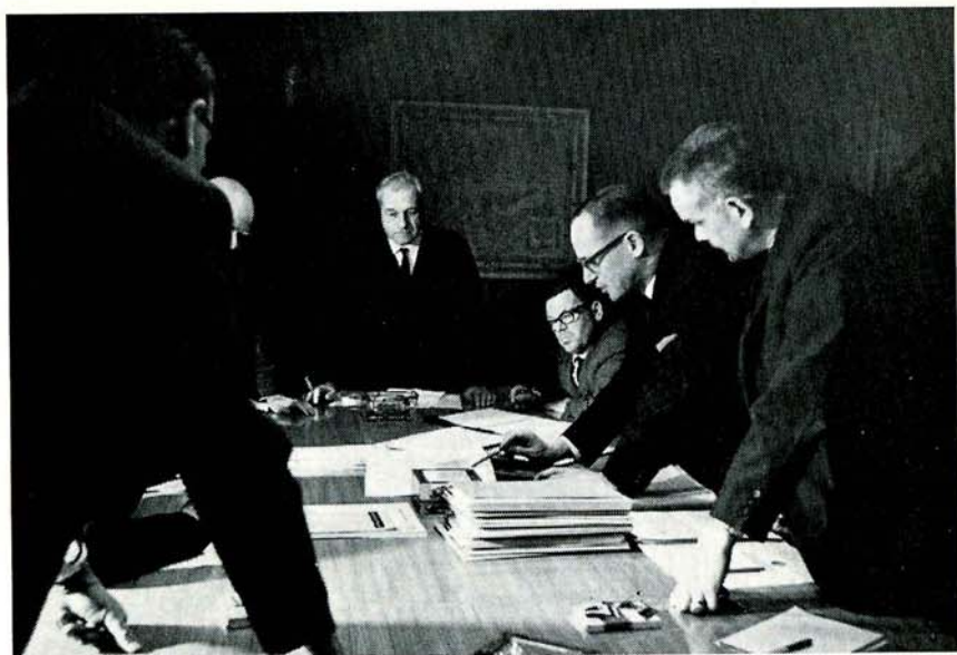
Die Änderung der Gemeindeordnung Die Gemeindeordnung vom 22. Februar 1954 wird wie folgt geändert: