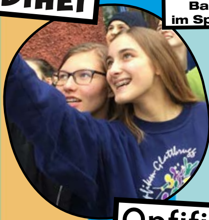
Jubiläumsfest und Bastelnachmittag im Spielraum ara Glatt