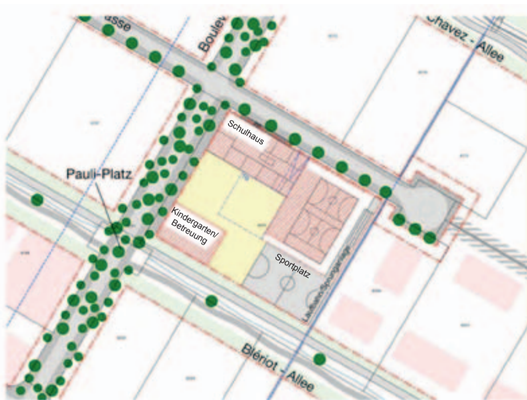
Mögliche Anordnung der geplanten Schulanlage im Quartier Glattpark

Gegen diesen Beschluss wurde mit Unterschrift von 13 Gemeinderatsmitgliedern das Referendum ergriffen. Somit ist der Beschluss des Gemeinderates vom Souverän zu genehmigen.