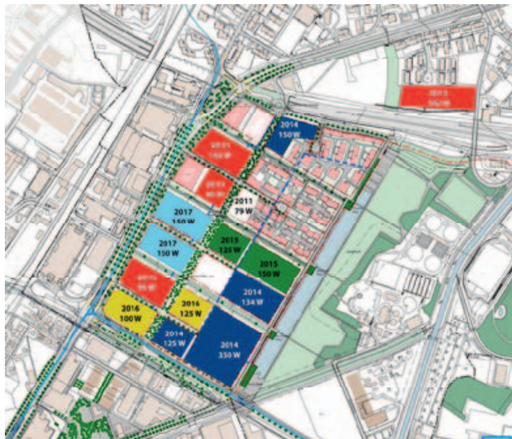
Mutmassliche Bauentwicklung im Quartier Glattpark (Erstellungsjahr / Anzahl geplante Wohnungen)

Schliesslich lehnte der Rat den Rückweisungsantrag mit 20 gegen 11 Stimmen ab. Der Antrag von Stadtrat und RPK wurde mit 19 gegen 11 Stimmen bei einer Enthaltung genehmigt. Aufgrund des danach durch 13 Mitglieder des Gemeinderates eingereichten Referendumsbegehrens gelangt der Beschluss des Gemeinderates vom 4. Juli 2011 über die Bewilligung eines Kredites von CHF 550'000 für die Planung und Durchführung eines Studienauftrages für den Neubau einer Schulanlage in Glattpark zur Volksabstimmung.