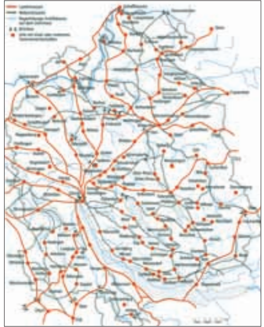
Das Zürcher Strassennetz um 1700.

regionaler Bedeutung erbauten. Dieses erwies sich als einer der Faktoren, die dem römischen Reich zu seiner immensen Ausdehnung und Macht verhelfen. Nur mit einem guten Strassennetz für die Legionen war es überhaupt möglich, das weit ausgedehnte und politisch brisante Gebiet zusammenzuhalten. Die römischen Strassen waren in einer Weise konstruiert, die sicherstellte, dass die Wege auch bei schlechtem Wetter befahrbar waren. Diese römischen Trassen wurden oft noch bis in die Neuzeit hinein weiterbenutzt.