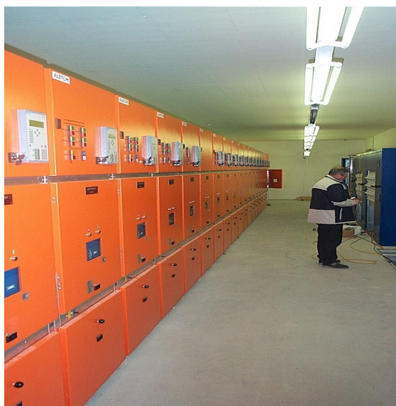
Bild: Für eine optimale Stromversorgung im neuen Stadtteil Glattpark baute das EWO eine neue Schalt- und Transformatorstation.

Für die Überdeckung der Flughafenautobahn wurden in Zusammenarbeit mit dem Kanton Zürich die Bauarbeiten für das neue Kabeltrasse und die neue Transformatorstation Bubenzholz abgeschlossen.