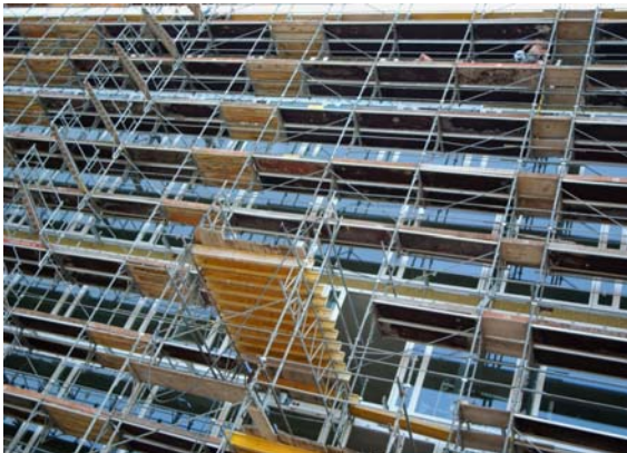
Bild: Gerüst beim Projekt Hotelplan

Die LEK-Koordinationsgruppe betreut weiterhin die naturnahe Bewirtschaftung im Siedlungsraum und verfolgt auch die Entstehung von neuen extensiven Anlagen. Im Weiteren hat sie zusammen mit dem Gartenbauamt der Stadt einige öffentliche Veranstaltungen durchgeführt.