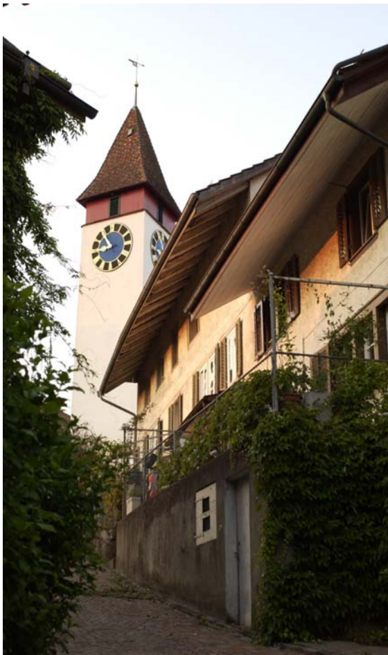
Bild: Kernzone Opfikon

Revision Kernzonenplanung Opfikon: Gegen den Festsetzungsbeschluss des Gemeinderates wird ein Rekurs durch einen Grundeigentümer eingereicht. Da dieser sich vor allem gegen eine vorsorgliche Vergrößerung der Grundwasserschutzzone richtete, soll er separat im Zusammenhang mit der Auflage betreffend der Schutzzonevergrößerung der Wasserversorgung beurteilt werden. Die Genehmigung der Revision durch die Baudirektion ist noch ausstehend.