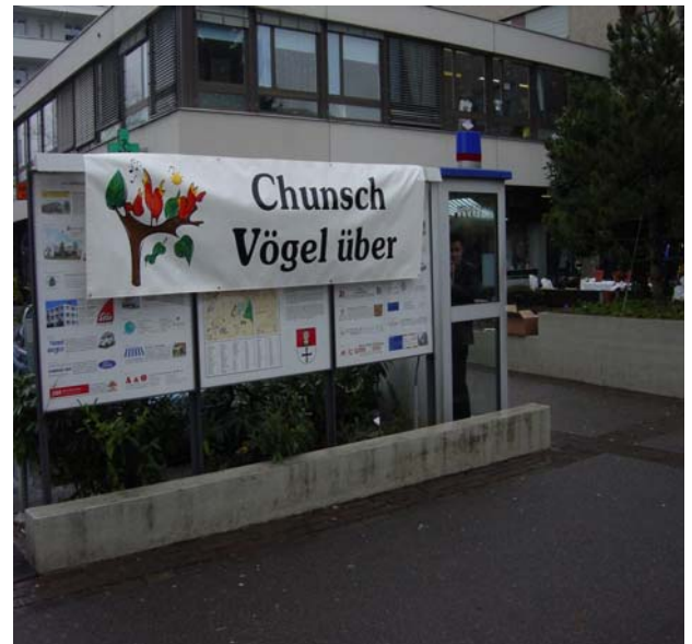
Bild: Einheimische Sträucher werden verschenkt