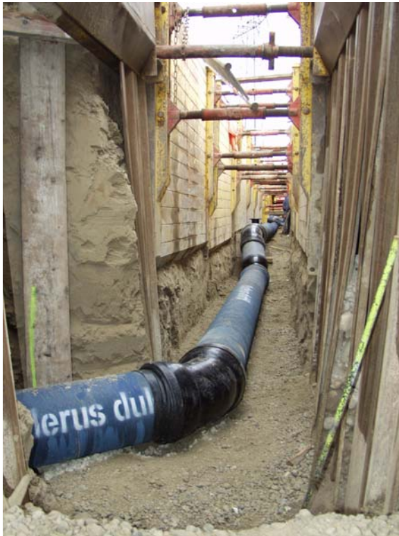
Bild: Wasserleitungsbau für die Erschliessung des Glattparks.

2003 ist die Energie Opfikon AG für die Elektrizitäts- und Wasserversorgung in der Stadt Opfikon tätig.