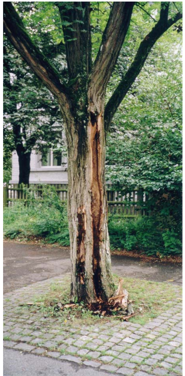
Bild: Kranker Baum

In den Park- und Schulanlagen wurden zahlreiche alte bestehende Pflanzen und Bäume stark zurückgeschnitten. Die extensive Pflege von öffentlichen und privaten Anlagen soll gefördert werden. Weiterhin Mühe bereiten die verschiedenen Pflanzenkrankheiten wie zum Beispiel der Feuerbrand. Das bei uns noch unbekanntere Schwarzföhrensterben wirft zudem einige Fragen auf. Für die Krankheiten bestehen keine Behandlungsmöglichkeiten, die Bäume müssen ersetzt werden.