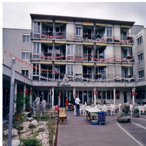
Bild: Alterszentrum Gibeich / Vorbereitung für die 1. August-Feier

Am 4. November 2002 bewilligte der Gemeinderat einen Kredit für die Realisierung einer betreuten Wohngruppe für Betagte.