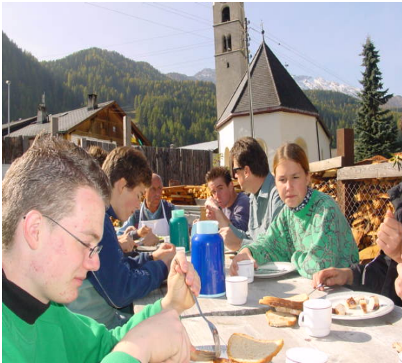
Bild: Kraft schöpfen in Valchava

Der Citybus war im Jahr 2002 an 146 (153) Tagen vermietet (vorwiegend an Ortsvereine).