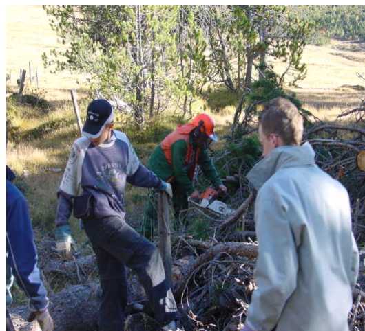
Bild: Es wurde hart gearbeitet, aber auch viel für die Zusammengehörigkeit getan

Zum zweiten Mal wurde eine Arbeitswoche in unserer Patengemeinde Valchava durchgeführt, in welcher gut zwanzig Jugendliche zusammen mit den Leiterinnen und Leitern von der Jugendarbeit Opfikon und zwei Senioren aus Opfikon verschiedene Arbeiten zu Gunsten der Gemeinde verrichteten.