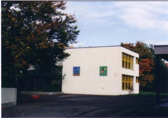
Bild: Schulhaus Mettlen eingebettet in viel Natur

klasse unterrichtet, im Sitzungszimmer der Schulpflege sind Kurse in heimatlicher Sprache und Kultur (HSK) untergebracht.